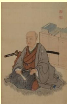
「神全塾第二代塾主 武田応呼龍先生像」

「神全塾武田家資料報告会 (9/16ミライズホール)」 で紹介される資料を中心に、 明治維新时期に活躍した稲田家 家臣団を育んだ神全塾の資料 を展示します。